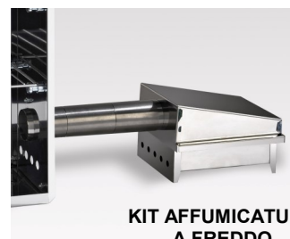
KIT AFFUMICATURA A FREDDO