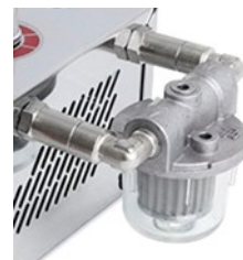
9709 NELF Versione con filtro